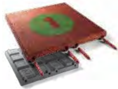
Maße | dimensions (L x B x H): 500 x 500 x 30/40/45/65/80 mm