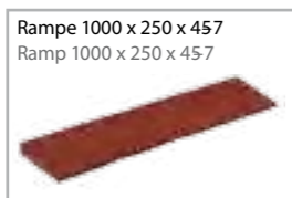
Rampe 1000 x 250 x 457 Ramp 1000 x 250 x 457 ramp for 45 mm slabs