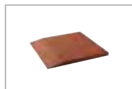
einseitig abgeschrägt bevelled on one side

Allgemeine Verlegehinweise online unter | General instructions on www.conradi-kaiser.de/downloads