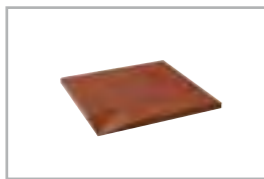
innen abgeschrägt bevelled inside