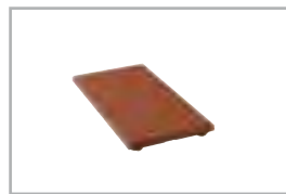
halbe Platte half safety slab