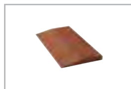
halbe einseitig abgeschrägt (Nur bis 45 mm Stärke erhältlich) half slab bevelled (Only available up to 45 mm thickness)