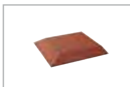
beidseitig abgeschrägt bevelled on both sides